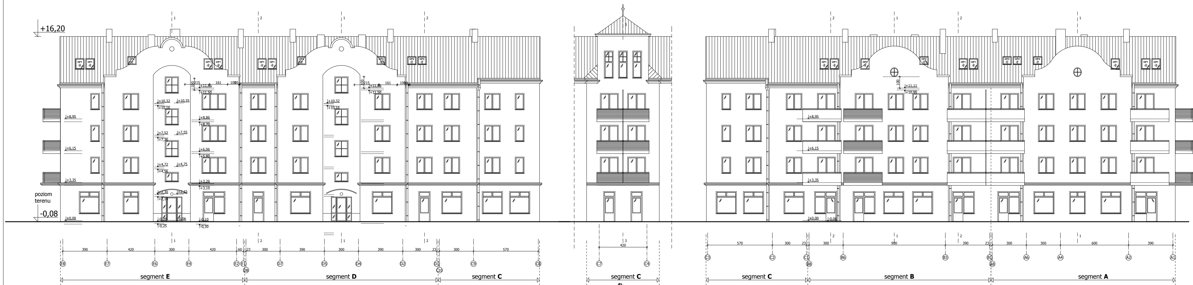
elevacja frontowa stan projektowany