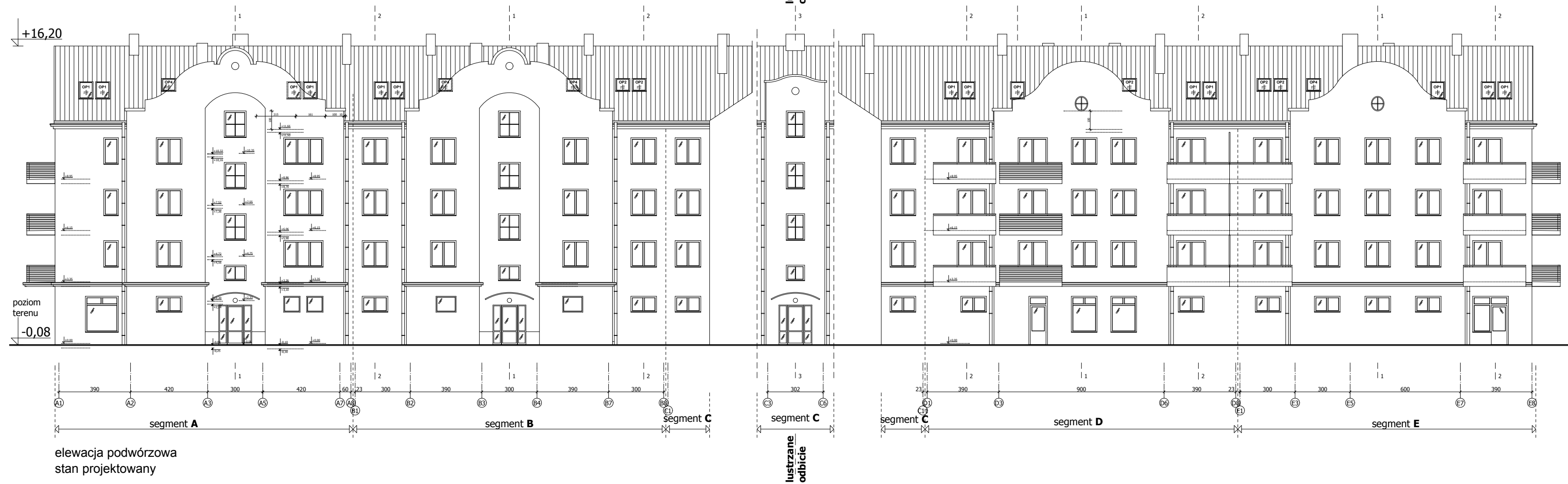
elevacja podwórzowa stan projektowany